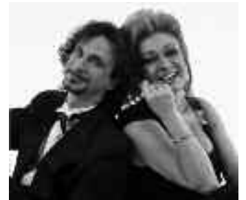
Fabio Armiliato e Daniela Dessi